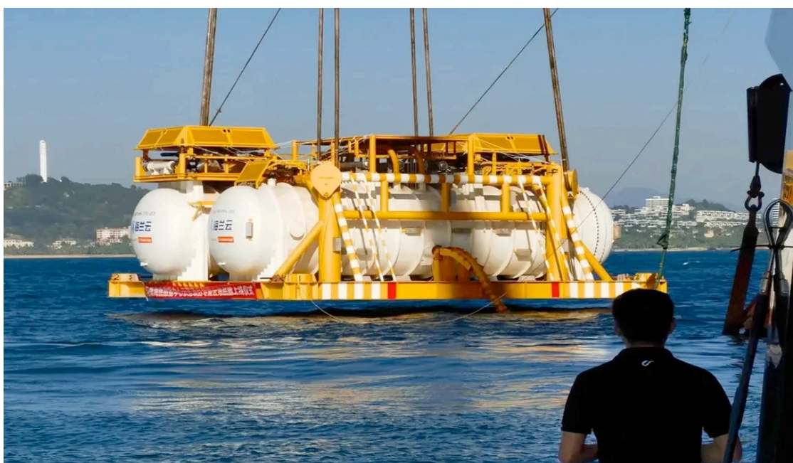
Figura 2 - Data centers mergulhados no mar