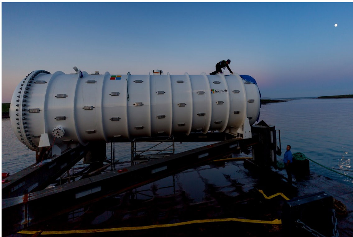
Figura 1. Data center das Ilhas do Norte do Projeto Natic.